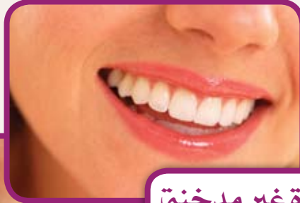
أسنان فتاة غير مدخنة