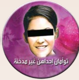
توأمان إحداهن غير مدفنة

أضرار التدخين وآثاره المهلكتة أكثر من أن تُعد أو تُحصى علاقة التدخين ببعض الأمراض الجلدية الجمالية