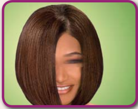
شعر فتاة غير مدخنة