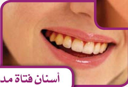
أسنان فتاة مدخنة