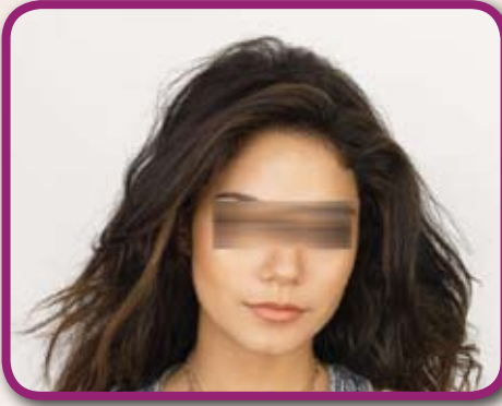
شعر فتاة مدخنة

كما ذكرت الدراسات علاقةً مهمةً بين التدخين والشيب المبكر بسبب تأثر الخلايا الميلانينية في جذر الشعرة والتي تكسب الشعرة لونها، حيث تفقد تدريجياً قدرتها على إنتاج الميلانين (الصباغ الملون للشعرة) مما يسبب فقدان التدريجي للون. إن هذا التأثير يشمل الذكور والإناث على حد سواء، ويسبب مظهراً متقدماً بالسن يُضاف إلى باقي المظاهر الأخرى والتي تحدثنا عن بعضها